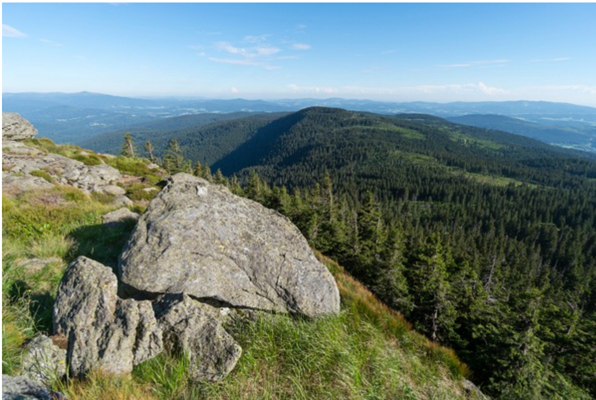
Etwas ausserhalb unserer Region - aber trotzdem sehr reizvoll: Der Bayerische Wald

In Deutschland war man in dieser Hinsicht deutlich langsamer. Mit dem Nationalpark Bayerischer Wald wurde hierzulande erst 1970, also vor knapp 50 Jahren, der erste Nationalpark geschaffen. Mittlerweile gibt es bundesweit aber immerhin 16 Schutzzonen dieser Art. Die zweitgrößte davon ist das Niedersächsische Wattenmeer. Das 1986 als Nationalpark, 1992 als UNESCO Biosphärenreservat und 2009 als UNESCO Weltnaturerbe eingestufte Gebiet umfasst eine Fläche von 345.800 Hektar und erstreckt sich von der Elbmündung bis an die niederländische Grenze. Vorrangig geschützte Lebensräume sind das Ökosystem Wattenmeer sowie die Salzwiesen und die Dünen der Ostfriesischen Inseln.