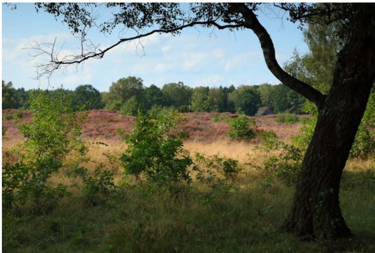
Der Naturpark Wildeshauser Geest

Zu den bundesweit größten Gebieten dieser Art gehört der 1.500 Quadratkilometer große Naturpark Wildeshauser Geest. Typisch für die Fläche ist eine leicht hügelige Landschaft, in der sich artenreiche Mischwälder mit Äckern, Wiesen und Weiden abwechseln - die aber auch Flussläufe, Heideflächen und Moore bietet. Zu den beliebtesten Freizeitaktivitäten vor Ort zählen eine Kanufahrt auf der Hunte oder die Besichtigung der Jahrtausende alten Großsteingräber in der Region. Eine besondere Gelegenheit dazu bietet die insgesamt 380 Kilometer lange Radroute der Megalithkultur, die an fast 20 dieser alten Gräber vorbeiführt und damit einen spannenden Einblick auf 5.500 Jahre Kulturgeschichte ermöglicht.